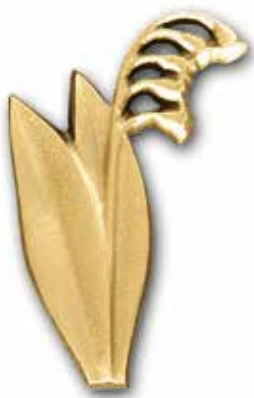
21. Kielo 100 x 60 mm