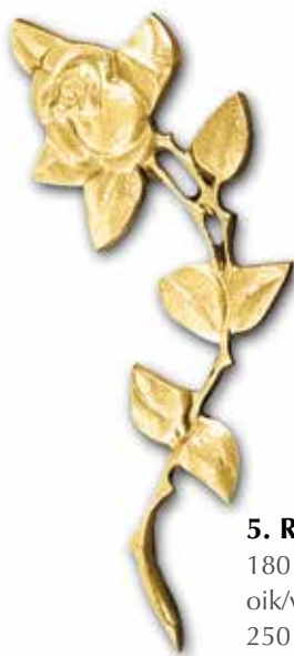
5. Ruusu 180 x 70 mm, oik/vas 250 x 90 mm, oik/vas