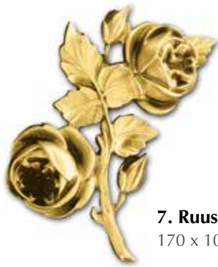
7. Ruusu 170 x 100 mm