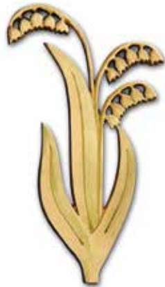
12. Kielo 150 x 90 mm 190 x 110 mm 250 x 150 mm