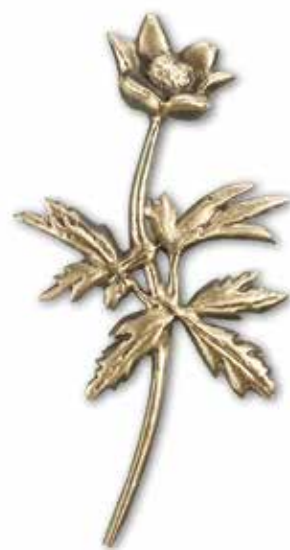
24. Valkovuokko 170 x 90 mm