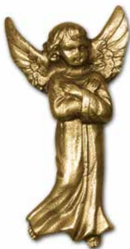
12. Enkeli 100 x 50 mm, oik/vas