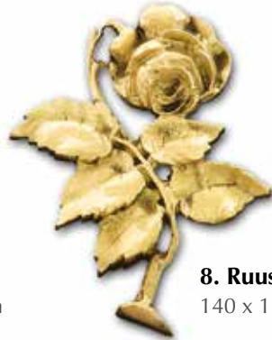
8. Ruusu 140 x 110 mm