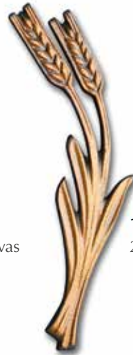
12. Kaksitähkäinen vilja 200 x 70 mm, oik/vas