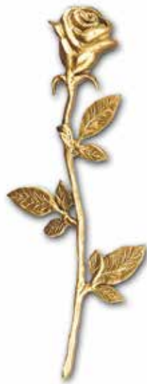
22. Ruusu 140 x 55 mm 180 x 80 mm 350 x 150 mm