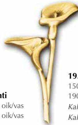
20. Kallanlehti 140 x 50 mm, oik/vas 180 x 65 mm, oik/vas