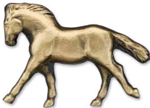
27. Suomenhevonen 105 x 150 mm kiinnitetään kiven etupintaan