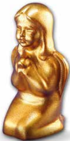
A. 110 x 60 x 70 mm