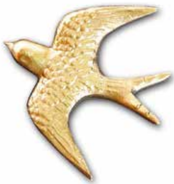
1. Pääsky siipien väli 60 mm 75 mm 95 mm 120 mm 135 mm