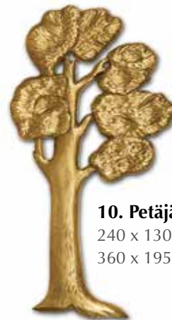
10. Petäjä 240 x 130 mm 360 x 195 mm