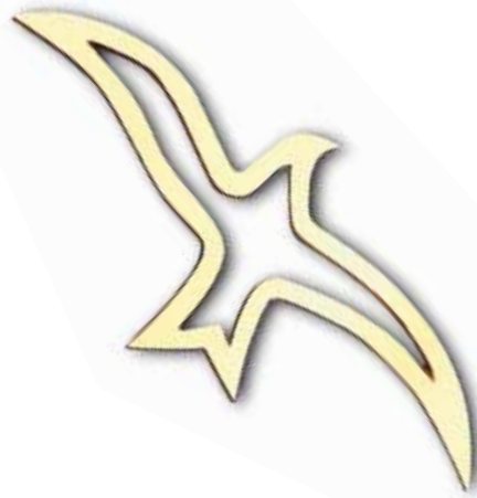
2. Lokki siipien väli 140 mm, oik/vas 190 mm, oik/vas 250 mm, oik/vas