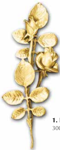
1. Ruusu 300 x 100 mm