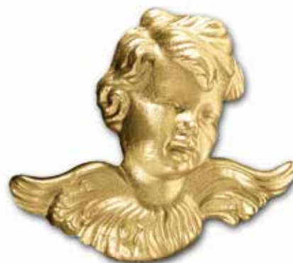
7. Enkeli 115 x 130 mm