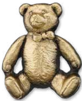
26. Nalle 90 x 80 mm kiinnitetään kiven etupintaan