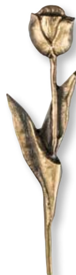
27. Tulppaani 150 x 40 mm