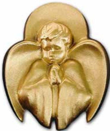
6. Enkeli 165 x 135 mm