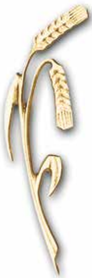
5. Tähkät 150 x 45 mm, oik/vas 210 x 55 mm, oik/vas 280 x 70 mm, oik/vas