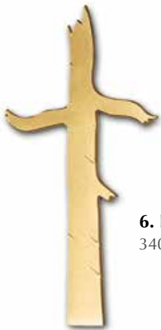
6. Runko 340 x 170 mm