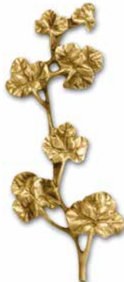
23. Muratti 190 x 75 mm