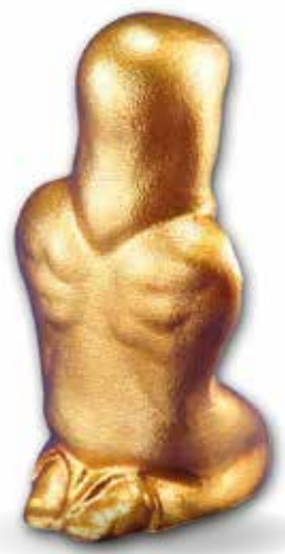
Rukoileva enkeli taustapuolelta