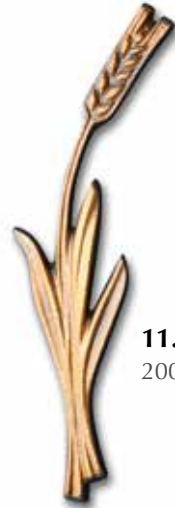
11. Vilja 200 x 50 mm, oik/vas