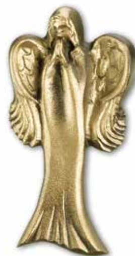
17. Enkeli 150 x 80 mm, oik/vas