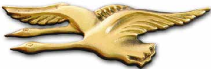
3. Joutsenpari 200 x 60 mm, oik/vas 270 x 90 mm, oik/vas