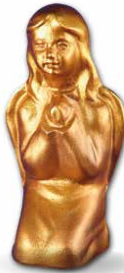
C. 170 x 80 x 95 mm