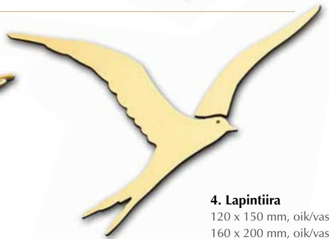
4. Lapintiira 120 x 150 mm, oik/vas 160 x 200 mm, oik/vas 210 x 320 mm, oik/vas