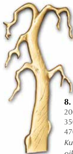
8. Kelo 200 x 105 mm, oik/vas 350 x 170 mm, oik/vas 470 x 220 mm, oik/vas Kuvan kelo kaartuu oikealle