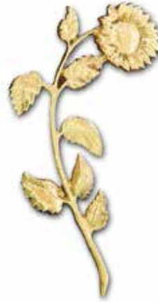
13. Päivänkakkara 190 x 100 mm, oik/vas