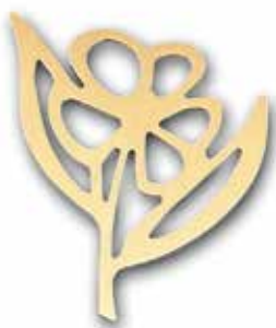
17. Pitsikukka 70 x 70 mm