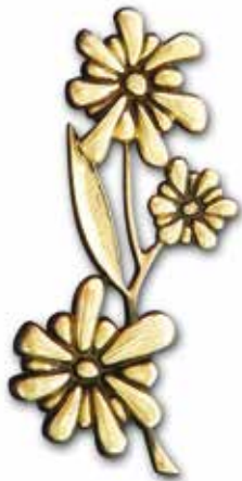
11. Krysanteemi 170 x 60 mm