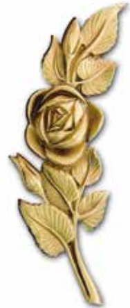
14. Ruusu 200 x 70 mm, oik/vas