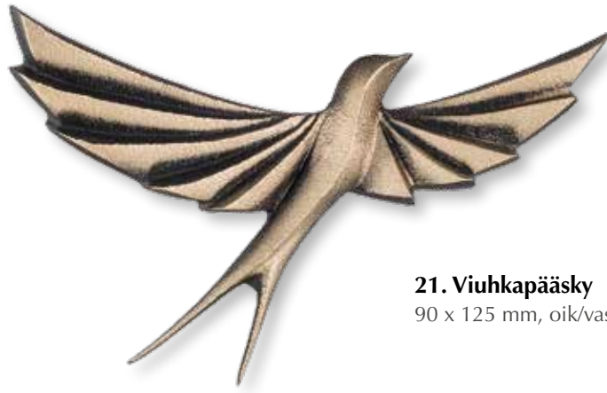
21. Viuhkapääsky 90 x 125 mm, oik/vas