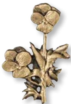
25. Orvokki 96 x 65 mm