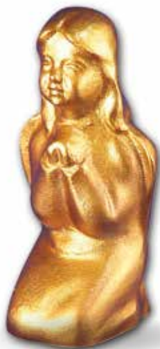
B. 140 x 70 x 75 mm