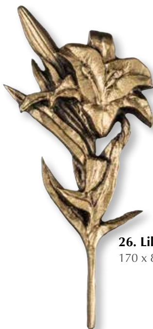
26. Lilja 170 x 80 mm