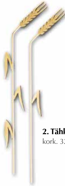
2. Tähkäpari kork. 320 mm, oik/vas