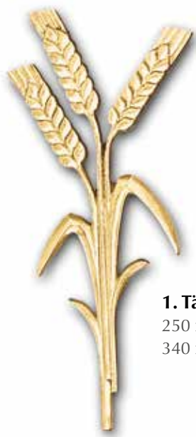
1. Tähkät 250 x 120 mm 340 x 160 mm