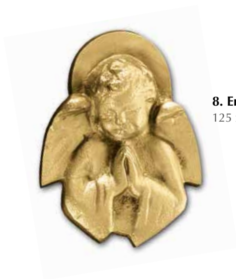
8. Enkeli 125 x 95 mm