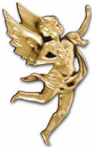
5. Enkeli 170 x 110 mm, oik/vas