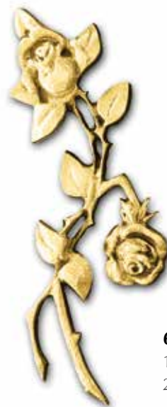
6. Ruusu 190 x 70 mm 280 x 100 mm