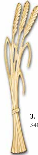
3. Lyhde 340 x 110 mm, oik/vas