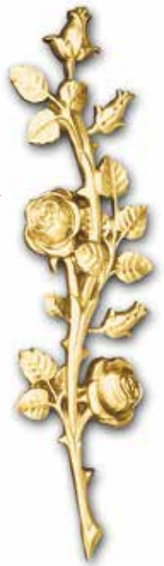
< 10. Ruusuköynnös 200 x 45 mm 300 x 65 mm