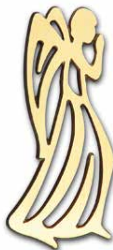
11. Pitsienkeli 150 x 70 mm, oik/vas