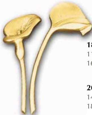
18. Kalla 115 x 50 mm 160 x 60 mm