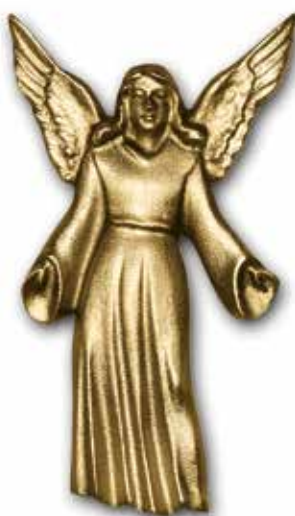
13. Suojelusenkeli 110 x 60 mm 160 x 85 mm